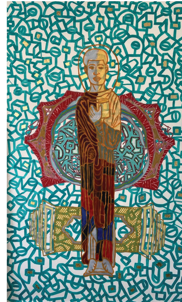
Marlon Forrester, StTrayvonFloyd23 , 2021. Acrylic, gold leaf on canvas, 97 x 61 inches (246.38 x 154.94 cm). Courtesy the artist. © Marlon Forrester

El pintor Marlon Forrester rinde un homenaje a cómo la raza, la identidad y la religión afectan el cuerpo masculino negro a través del deporte del basketbol. En sus pinturas, considera a los iconoclastas (quienes cuestionan las creencias establecidas y no se conforman con ellas), los motivos de las canchas de basketbol, las estructuras arquitectónicas relacionadas con los edificios religiosos, y números que funcionan como símbolos de transformación. Cada personaje funciona como el punto de un eje central en sus pinturas, y lo enmarcan fuertes líneas gestuales que se entrelazan y doblan a lo largo del fondo. Aplica marcas puntillistas que crean profundidad a la vez que mezcla los colores creando un efecto óptico que aporta palpitante energía y vida a las pinturas.